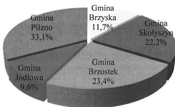
Wykres 1. Liczba ludności obszaru LGD „LIWOCZ” w podziale na gminy, w tym podział procentowy